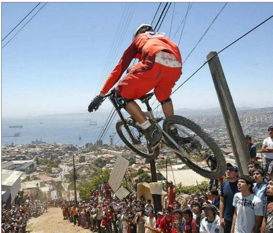
Usar el casco, ya sea en prácticas o en carreras, puede salvar la vida de los osados corredores.