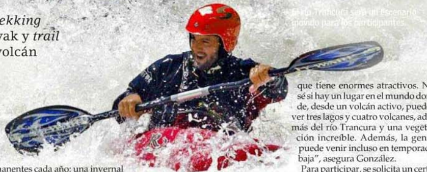
El Tetratlón será un escenario movido para los participantes.

El inicio será diferente. Casi en la cima del volcán Villarrica, con vista a tres lagos, una treintena de valientes competirá, este sábado, en el primer Tetratlón Pucón, que se disputará en la turística ciudad de La Araucanía. De allí arranca todo con trekking en nieve y sigue con mountainbike , kayak en el río Trancura y concluye con trail running . Una aventura que mezcla exigente esfuerzo deportivo con atractivos turísticos innegables, la apuesta de la organización para consolidar la prueba en el calendario outdoor del futuro. "La idea es que sean dos fechas