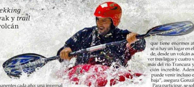
El río Trancura será un escenario movido para los participantes.

El inicio será diferente. Casi en la cima del volcán Villarrica, con vista a tres lagos, una treintena de valientes competirá, este sábado, en el primer Tetratlón Pucón, que se disputará en la turística ciudad de La Araucanía. De allí arranca todo con trekking en nieve y sigue con mountainbike , kayak en el río Trancura y concluye con trail running . Una aventura que mezcla exigente esfuerzo deportivo con atractivos turísticos innegables, la apuesta de la organización para consolidar la prueba en el calendario outdoor del futuro. "La idea es que sean dos fechas