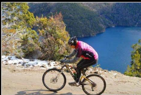
El ciclismo de montaña se disputará en los faldeos del volcán Villarrica.