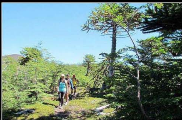
La prueba termina con una corrida en senderos rodeados de vegetación.

Más de cuatro mil inscritos (en damas y varones) darán vida este domingo al Maratón de Valparaíso. También hay recorridos de 10 y 21 km.